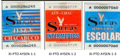
XI-PTO AYSEN-1-1 XI-PTO AYSEN-1-2 XI-PTO AYSEN-1-3